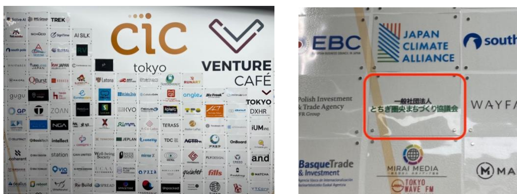
※CIC 内に掲示された入居企業のネームプレート

既に今月、栃木県内のスタートアップイベントの開催打合せも予定しており、新たな取り組みも進めて参ります。